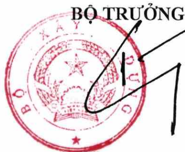
Nguyễn Thanh Nghị